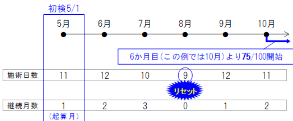
〔例1〕※初検日が5/1(月の前半)として

※施術日が月10回以上が5カ月間続いた場合、6カ月目以降は10回未満でも「継続月数」は「6」「7」「8」と続き、100分の50となります。